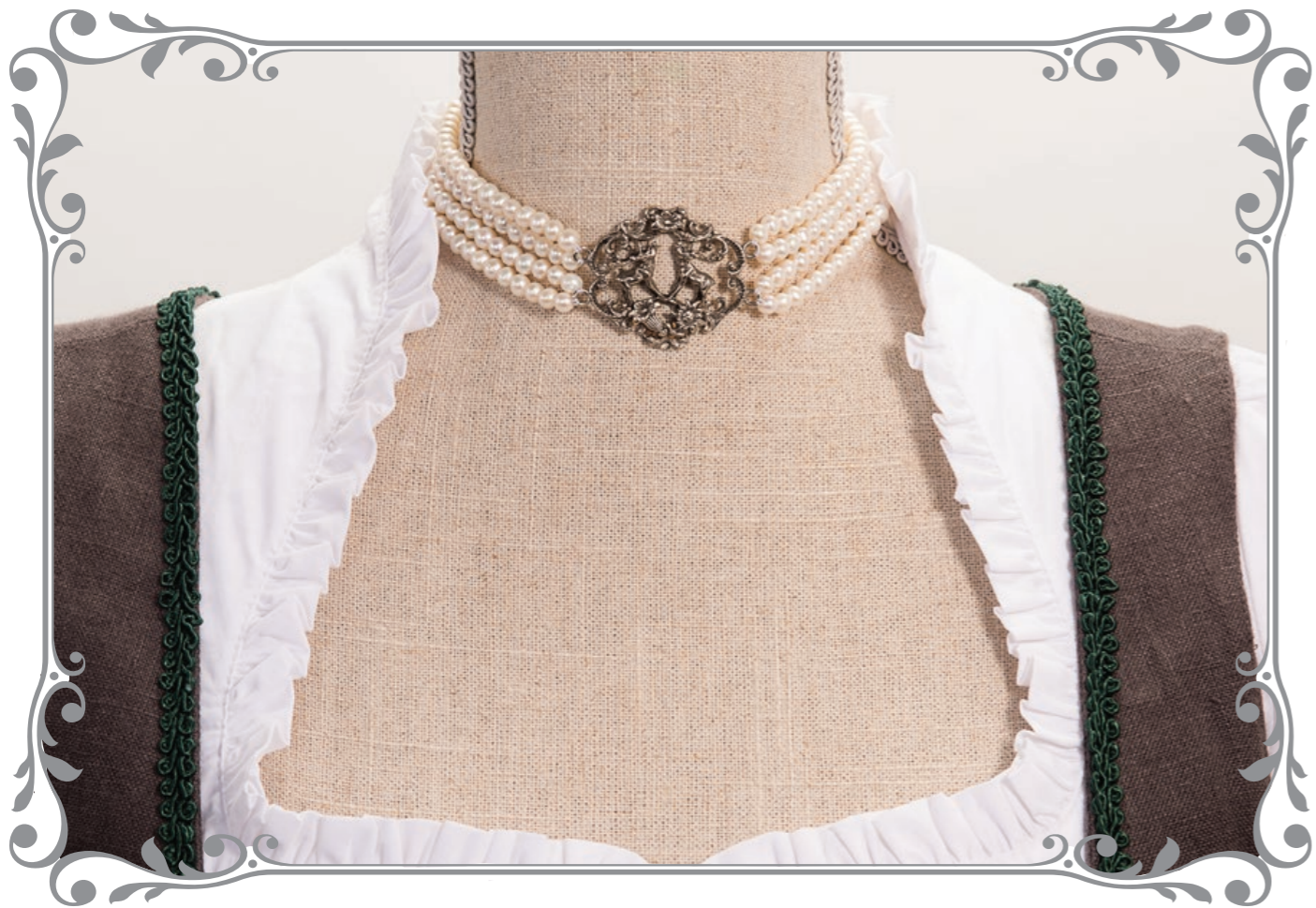
1280P Kropfkette Springender Hirsch