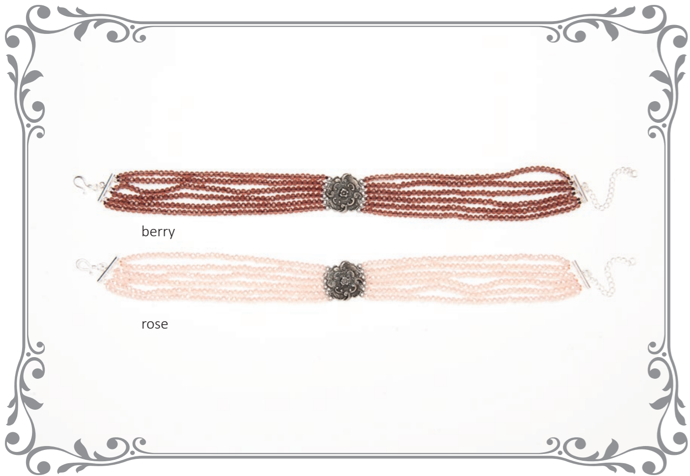
1270K Kropfkette Blume Kristall