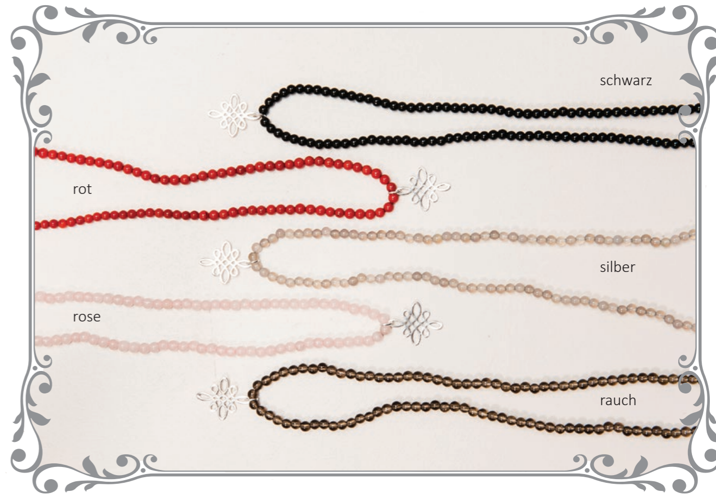
1513 Steinkette Knoten