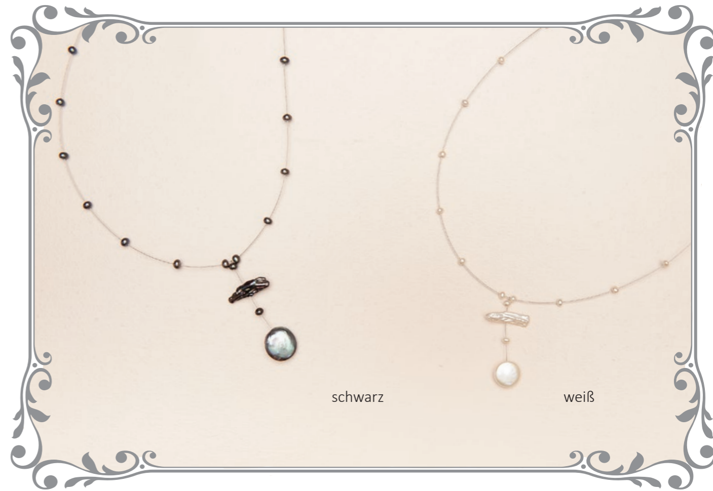
1320 Choker Perle