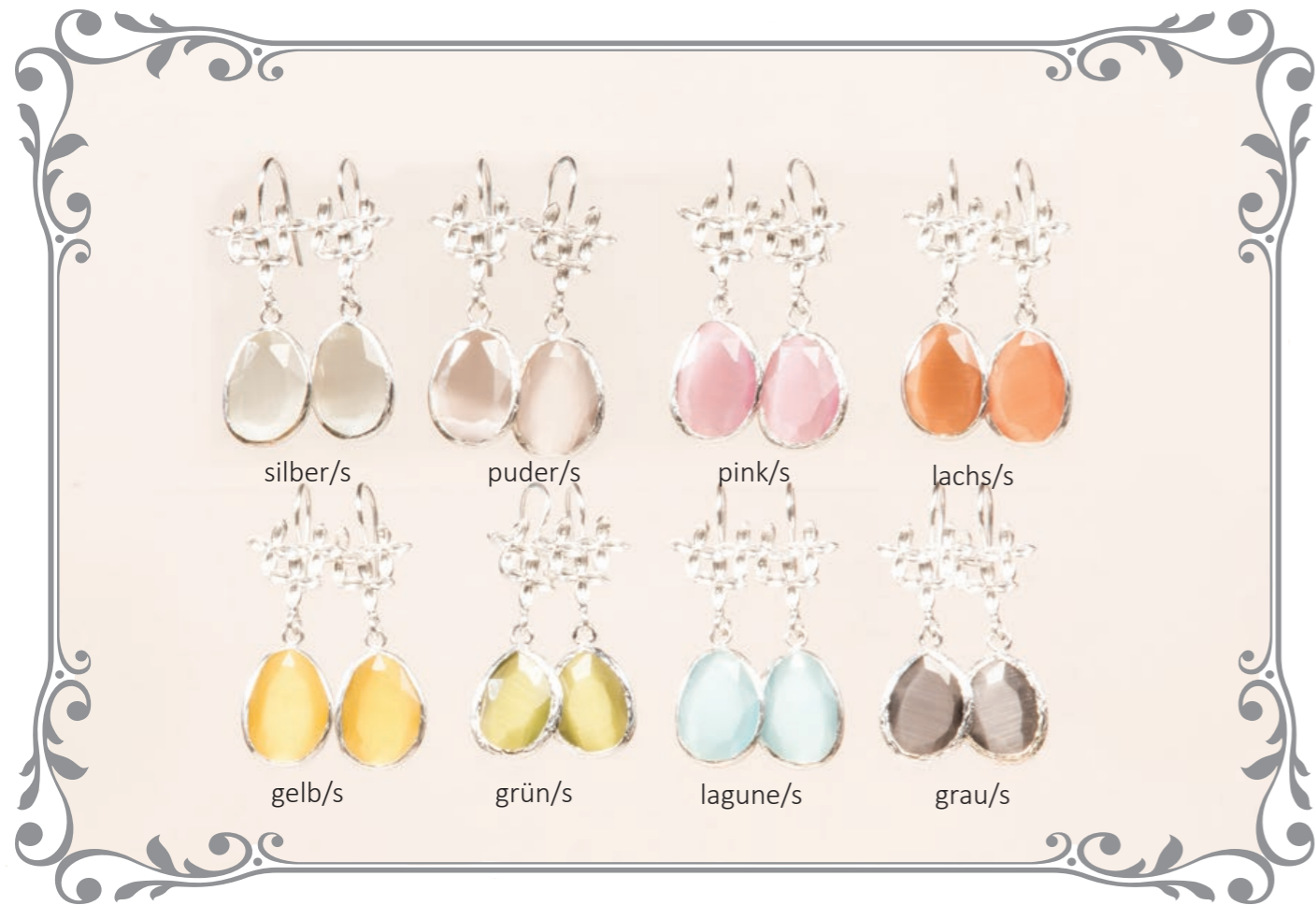
2018 Ohrring Drop Blume