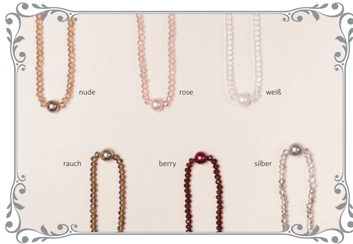
122 Kristallkette Perlmutterperle