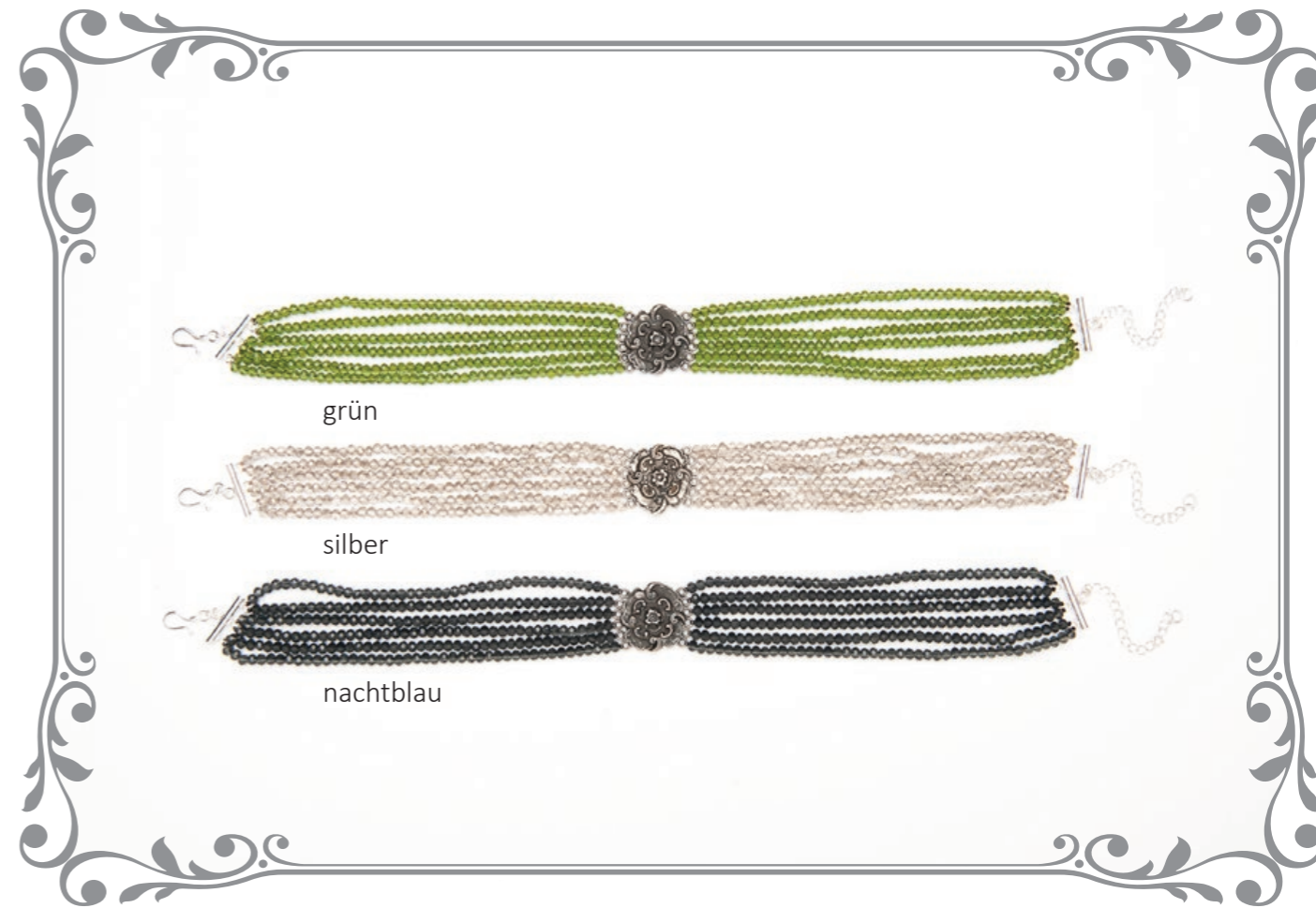
1270K Kropfkette Blume Kristall