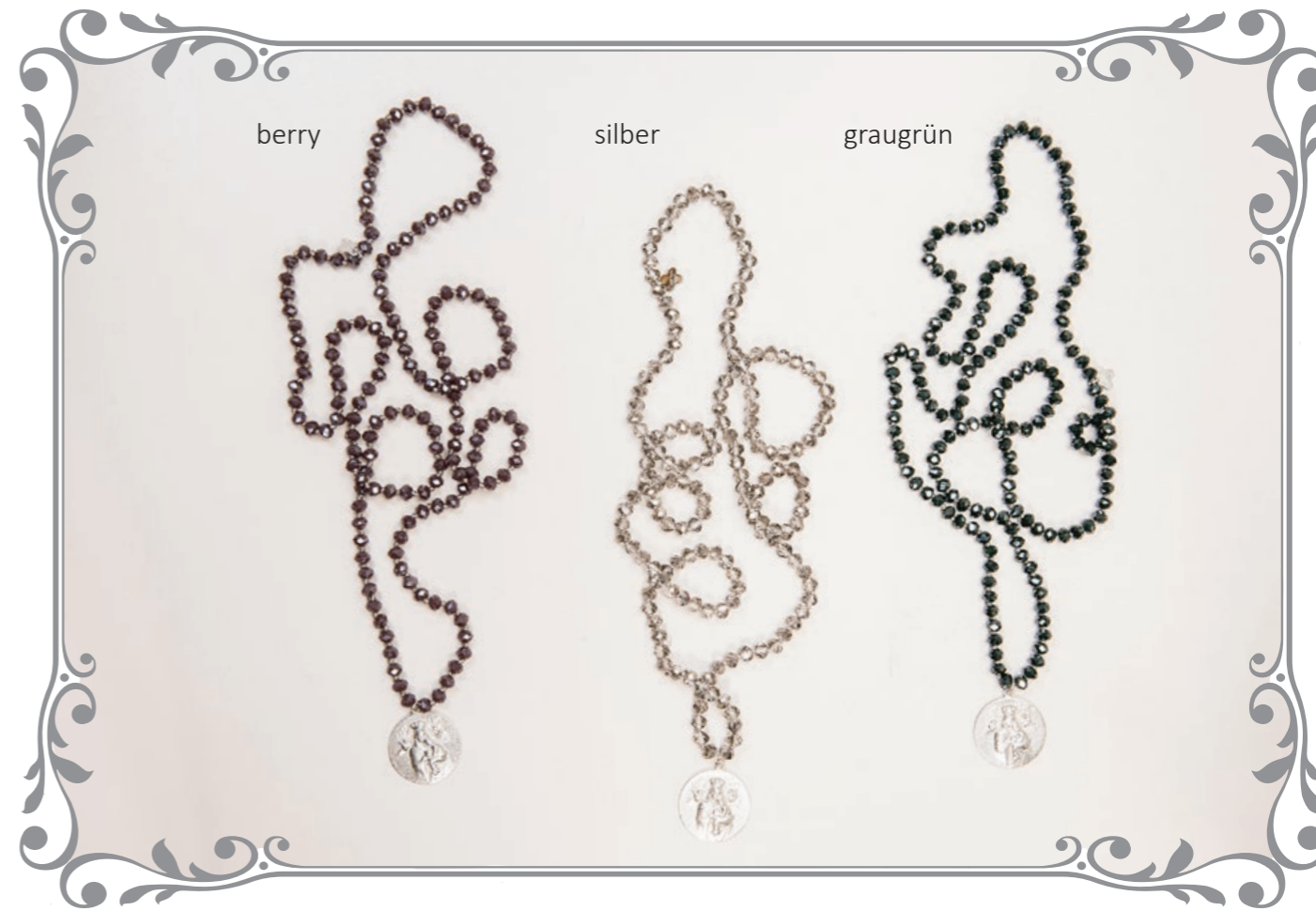
1543 Kristallkette Madonna (96 cm)