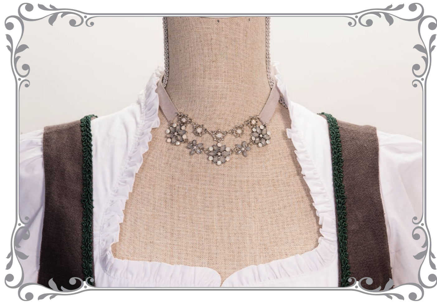
1310 Choker Blume