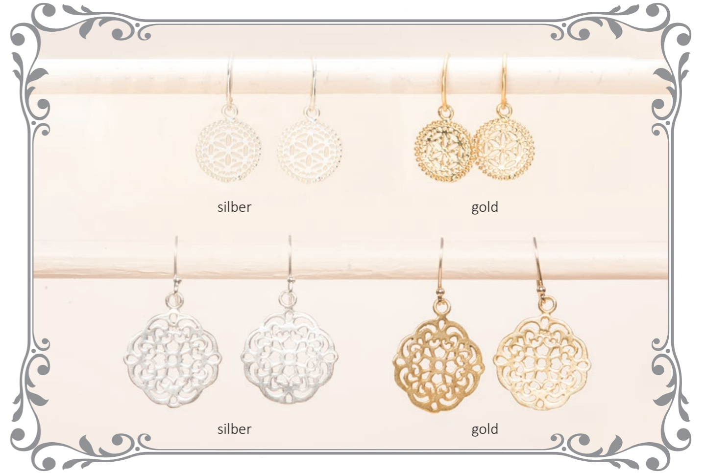
2010 Ohrring Ornament, 2016 Ohrring Jali