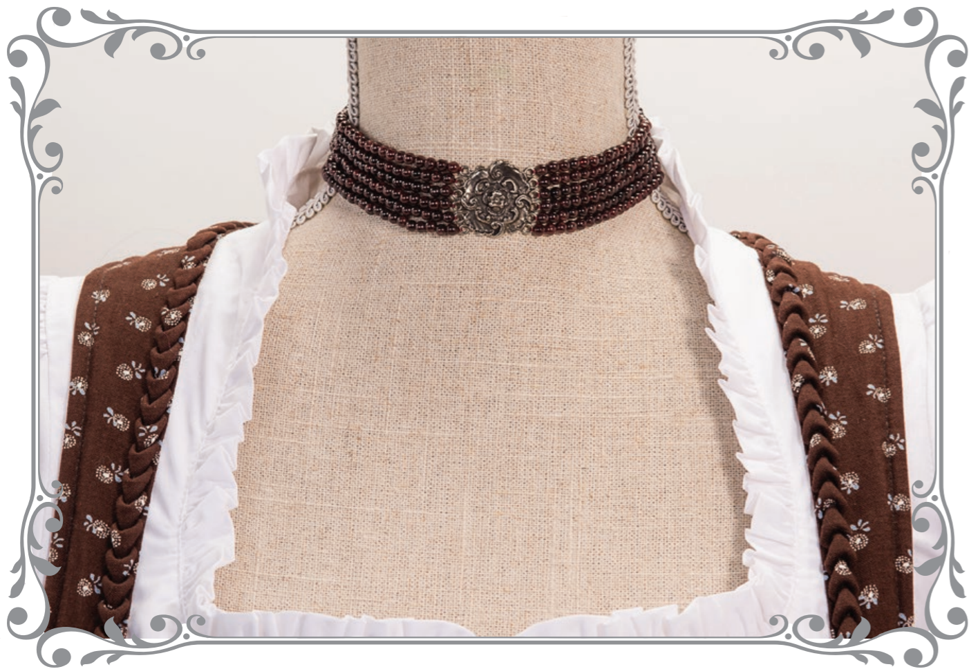
1270G Kropfkette Blume Granat