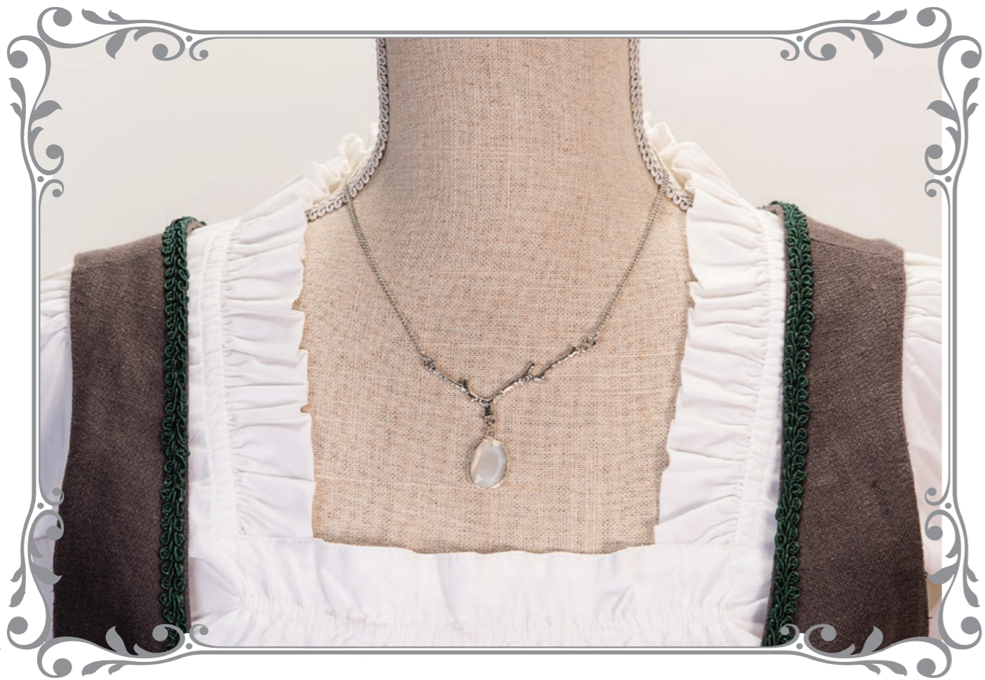
Farbauswahl analog Seite 75/76 (in Silber)