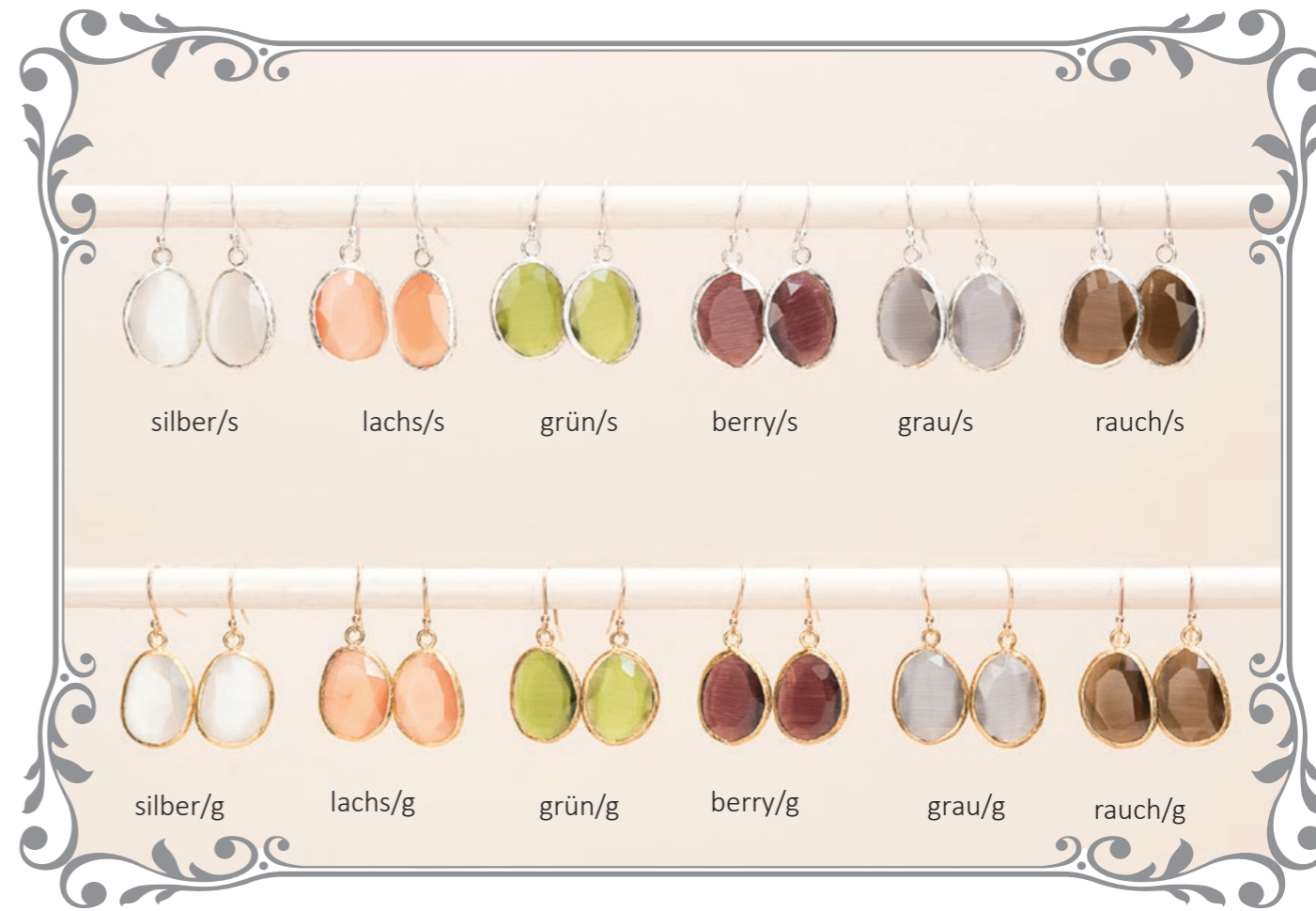
2013 Ohrring Drop oval