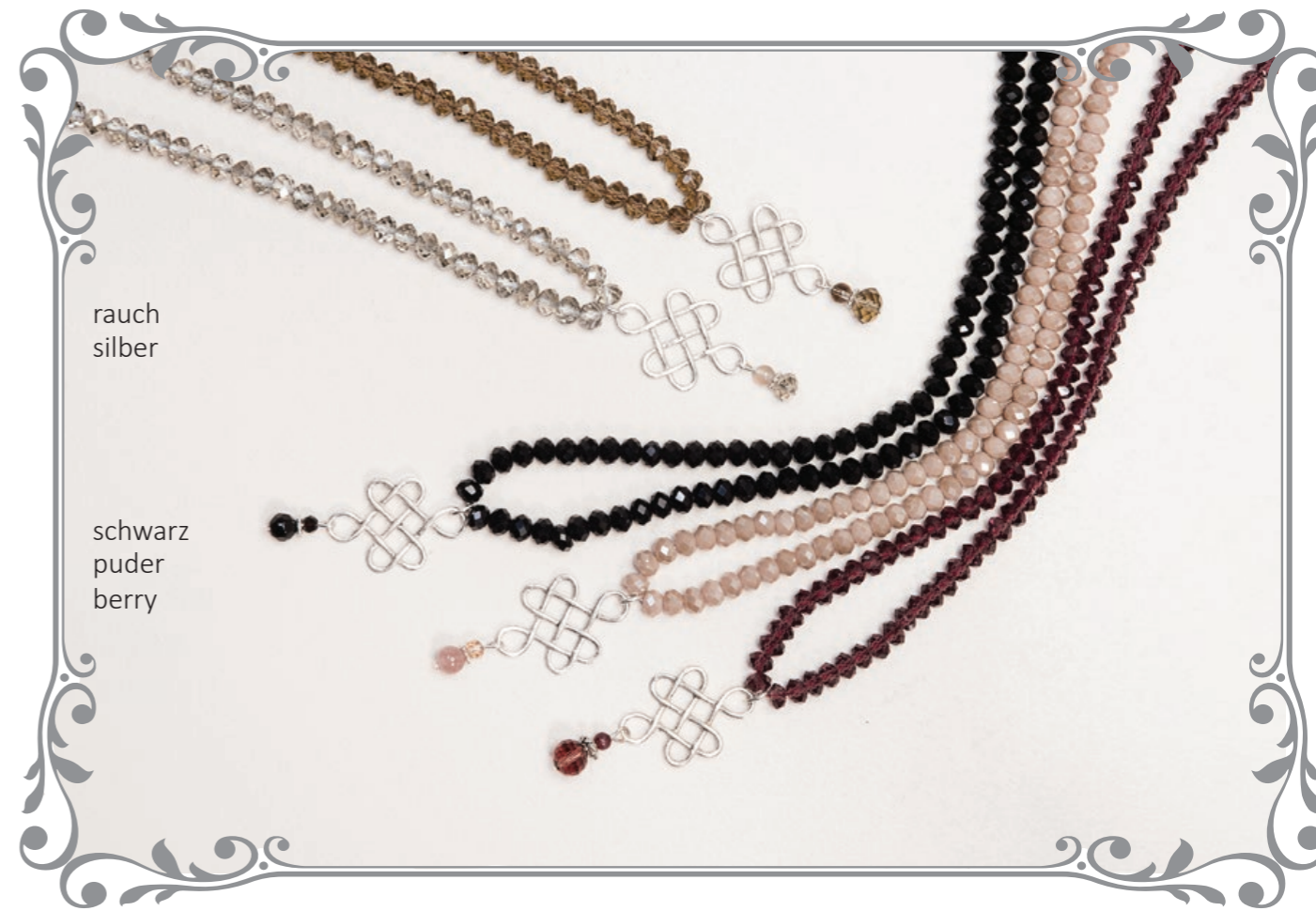
1547 Kristallkette Knoten