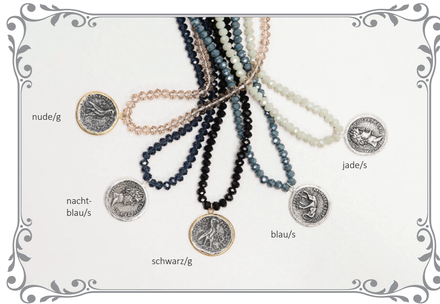
447 Kristallkette Münze