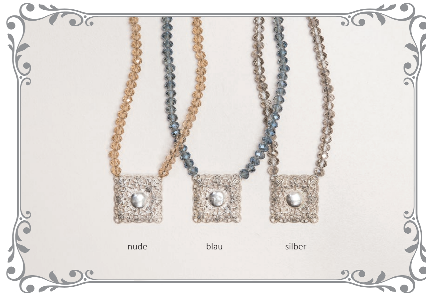
1247 Kristallkette Raute