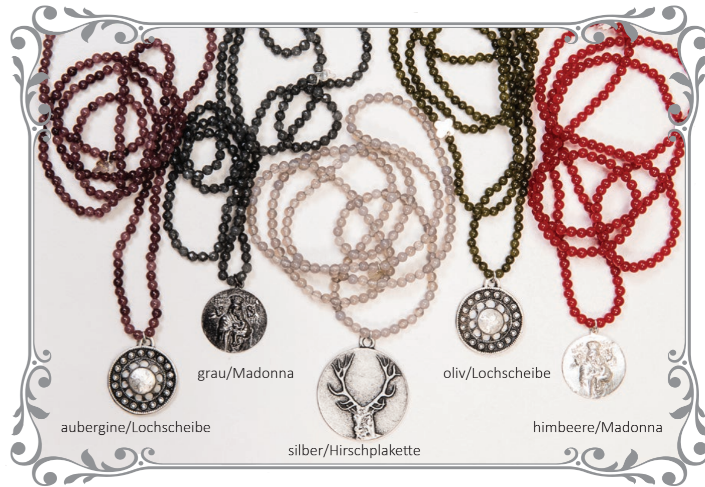
1514 Steinkette (92 cm)