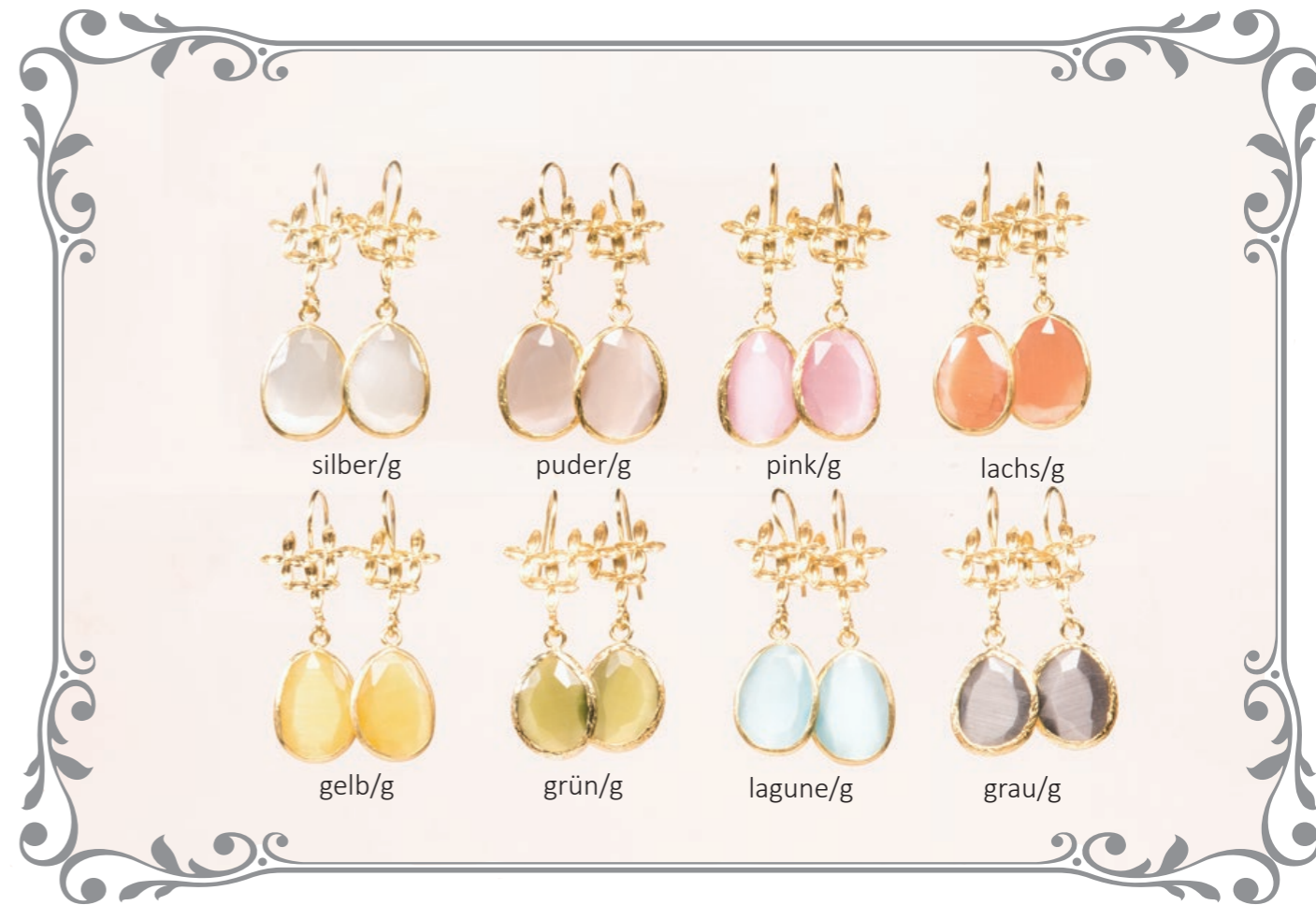
2018 Ohrring Drop Blume