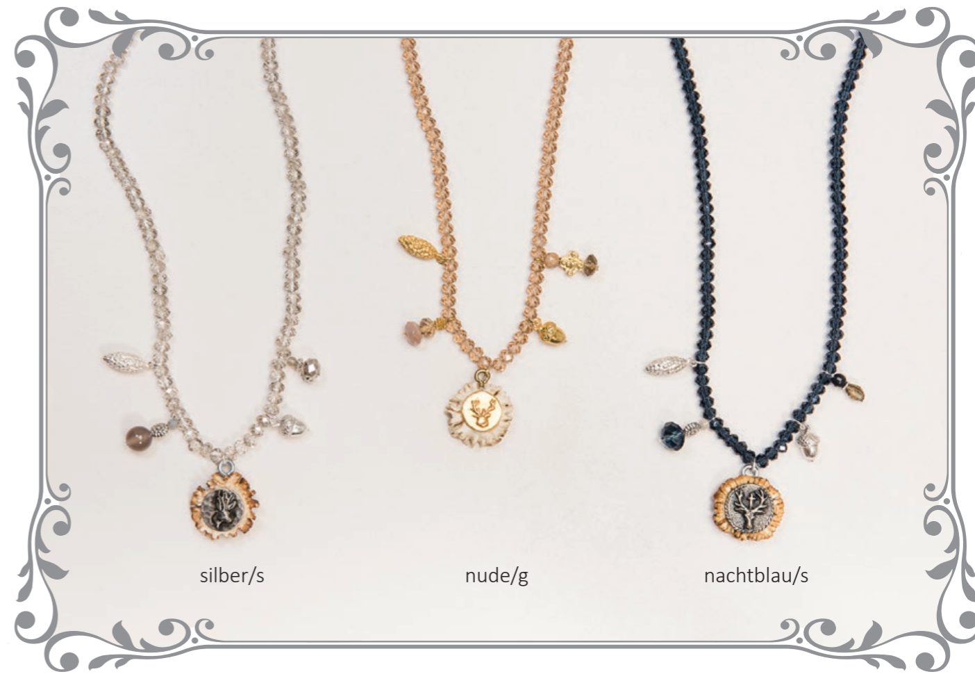
1249 Kristallkette Chari