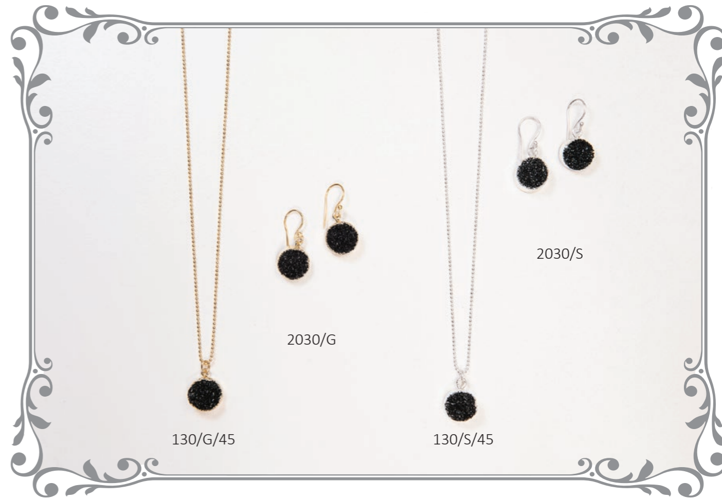
130 Kugelkette Druzy (925 Silber, Länge 45 cm), 2030 Ohrring Druzy